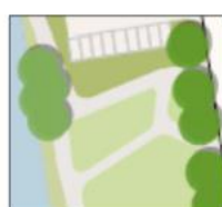
Parkgebied 1 (±195 m 2 )