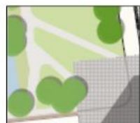
Parkgebied 3 (±175 m 2 )

van Woonpartners en de gemeente Gouda. Het doel van het park is om een plek te creëren waar bewoners elkaar op een ontspannen en recreatieve manier kunnen ontmoeten. De ongedwongen invulling van het park zorgt voor de mogelijkheid tot verbinden van mensen met verschillen de leeftijden, culturen en sociale achtergrond. Kortom positieve sociale cohesie in belangrijk voor de duurzaamheid van de wijk.